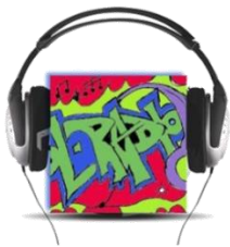
ΕΠΙΣΤΗΜΟΝΙΚΗ ΕΤΑΙΡΕΙΑ «European School Radio, Το Πρώτο Μαθητικό Ραδιόφωνο»